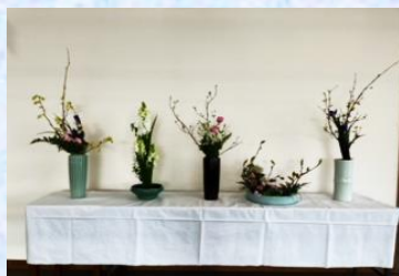
嵯峨御流いけばな