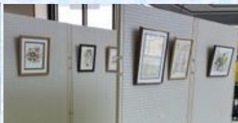
美しい水彩色えんぴつ