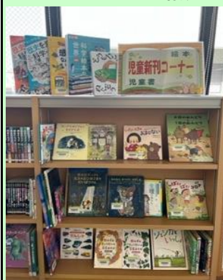
児童新刊コーナー

4月は「子ども読書の日特集」として、家族みんなで楽しみを共有できる絵本や物語、読み聞かせのポイントを紹介した本を特集します。